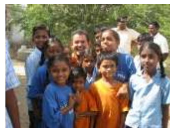
Onze 1e promo-filmpje