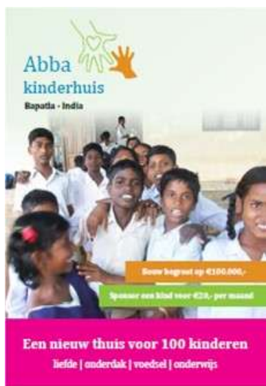
Onze 1 o folder – januari 2009

Terwijl de bouw in India van start ging, waren wij ondertussen hier in Nederland druk bezig met het werven van fondsen. Zo hebben we een website geopend: www.abbakinderhuis.nl . Ook zochten we de media en kreeg ik een paar artikelen in de lokale kranten. Verder hebben twee promofolders gemaakt en twee promofilmpjes voor internet en de lokale televisie. Daarnaast hebben we drie benefit concerten gegeven in Vlissingen, Ede en Loppersum.