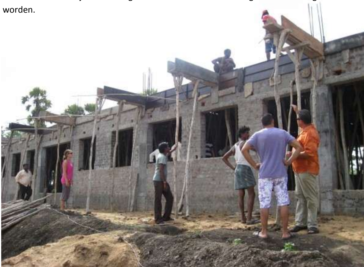
Het casco staat er en samen met mijn zonen en Kingsly inspecteren wij de vorderingen van de bouw van het huis

In augustus 2009 bracht ik met ons team een werkbezoek, zowel aan de kinderen in hun oude locaties, maar vooral ook om de bouwontwikkelingen met eigen ogen te zien. Het casco stond er al bijna en zo begonnen de contouren van het gebouw al aardig zichtbaar te worden.