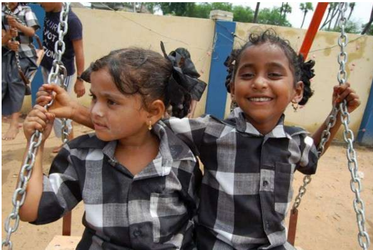
Een nieuwe toekomst voor deze prachtige kinderen, dat was de droom die we in gedachten hadden