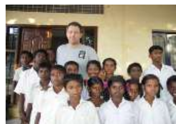
Onze 2e promo-filmpje

Klik op de bovenstaande folders om ze als PDF online te lezen, indien u dit document bekijkt op de computer. Ditzelfde geldt voor de promofilmjes die we voor dit project hebben gemaakt. U kunt deze dan online bekijken.