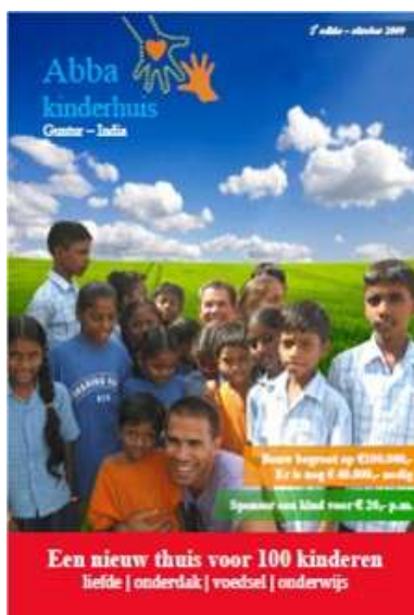
Onze 2 o folder – oktober 2009