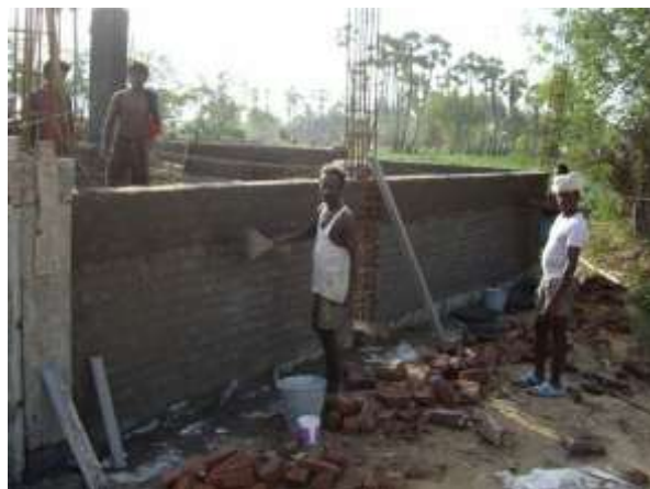
De fundamenten werden gelegd, de buitenmuren gemetseld en de kolommen gingen de lucht in. Mei-Juni 2009