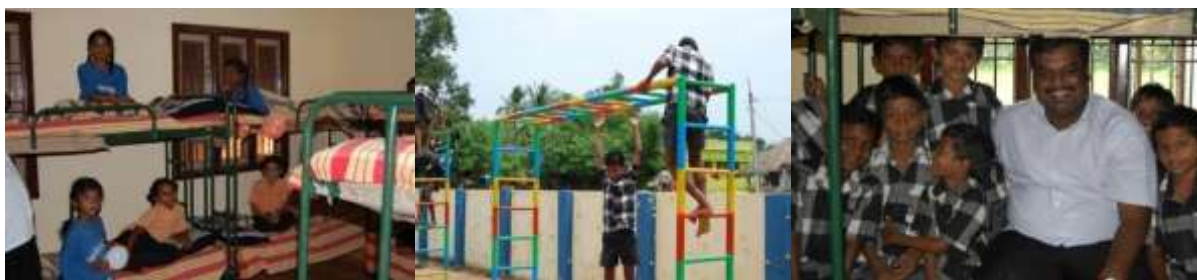
De meisjes op hun nieuwe kamer

Uiteindelijk brak het moment aan dat de kinderen naar hun nieuwe onderkomen konden verhuizen. Ze waren buitengewoon opgewonden en konden niet wachten. Het was half augustus 2010 dat de verhuizing van de kinderen was geplant. Aan hun gezichten is te zien dat ze het gewoon geweldig vonden om in zo'n mooi huis te wonen.